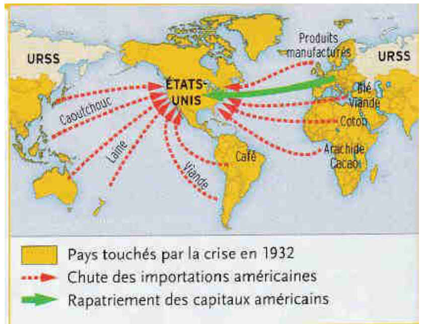
Doc.3 : une crise économique mondiale

Paul Reynaud (1878-1966) est député de Paris en 1928 avant de devenir ministre de l'économie en 1930 et 1938 puis Président du Conseil en 1940.