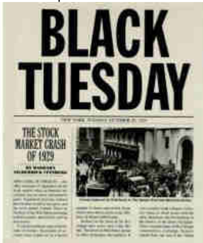
Doc.1 : Panique à Wall Street

Témoignage de Paul Claudel, ambassadeur de France à Washington entre 1927 et 1933.