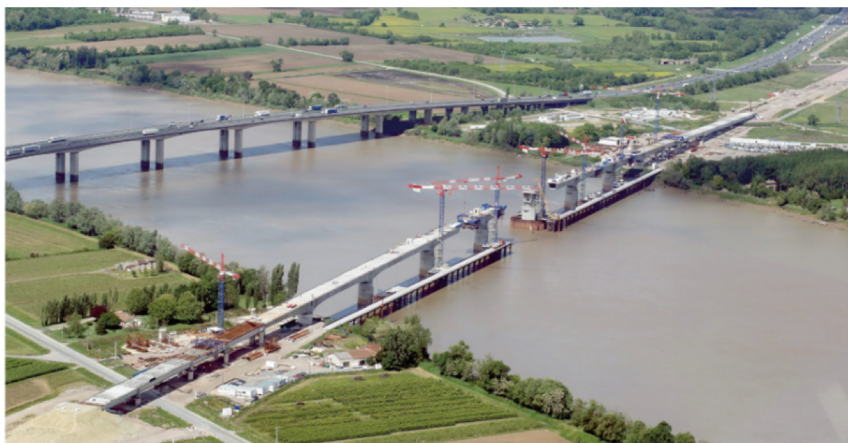
4 Un viaduc en construction près de Bordeaux pour le passage des TGV, 2014